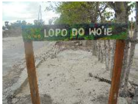
Lopo betekent ontmoetingsplaats Dowo'ie betekent waar ik leef