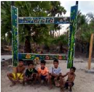
De kinderen waren trots om foto's te maken van het sportveld

De grond is daar zanderig en de bodem is niet helemaal recht waardoor extra maatregelen moeten worden genomen voor de aanleg van het sportveld.