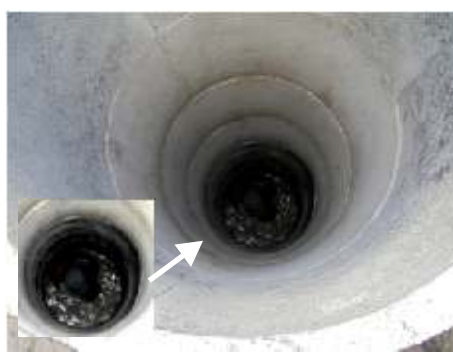
Iemand baggert de put uit