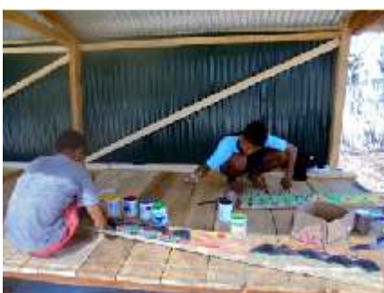
De entreeborden verven