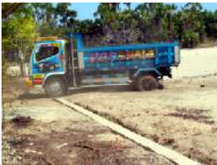
vrachtwagen om zand en stenen te vervoeren

Bouwen onder deze temperaturen is erg zwaar en vergt veel van de mensen.