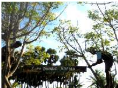
het naambord ophangen