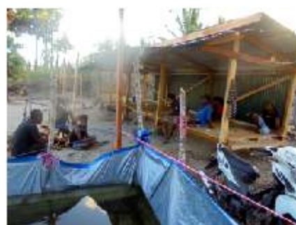
Watercontainer van zeildoek