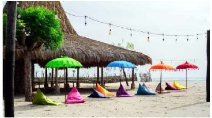
ClubCosta Beach Resort & Club 2,5 km van Kalala