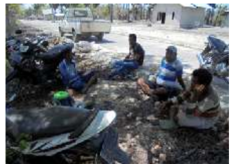
Aan het pauzeren