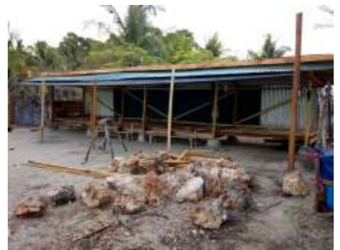
Lopo Dowo'ie betekent ontmoetingsplaats waar ik leef