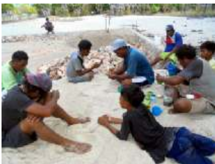
Aan het pauzeren