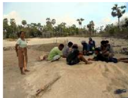
Aan het pauzeren