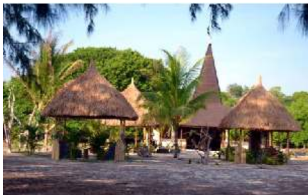
Dream Ecoresort Sumba Dream 1,5 km van Kalala