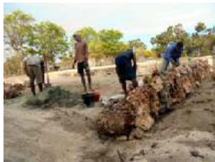
Het bouwen van de fundering voor het ontmoetinghuis