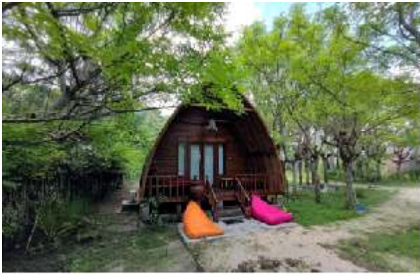
Wajonata Sumba 1,5 km van Kalala

In het dorp, grenzend aan het dorp Kalala, zijn veel hotels en resorts aan de rand van het strand. Buitenlandse toeristen die overnachten, zijn meestal mensen die van surfen houden. Deze hotels zijn geen eigendom van Indonesiërs of Sumbanese, maar van buitenlanders: Australiërs, Belgen, Fransen, Spanjaarden. Het bestaan van deze hotels betekent niet dat de economische situatie van de gemeenschap welvarender zal worden, het heeft geen enkel impact op de welvaart van de gemeenschap.