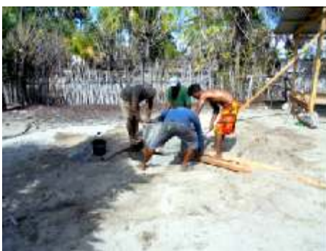
een paar mensen zetten de betonbuizen in de grond

We baden samen voor de juiste plek, zodat er een put met zoet water uit zou komen.