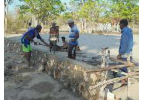
Het bouwen van de fundering voor het veld