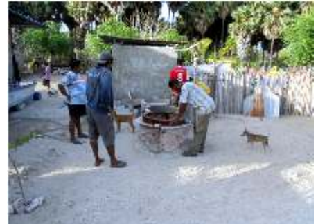
Betonbuizen voor de put ophalen bij een bedrijf